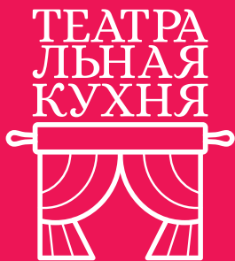
ГРАФИК РЕАЛИЗАЦИИ ВСЕРОССИЙСКОГО ОБРАЗОВАТЕЛЬНОГО ОНЛАЙН-КЛУБА ШКОЛЬНЫХ И САМОДЕЯТЕЛЬНЫХ ТЕАТРОВ «ТЕАТРАЛЬНАЯ КУХНЯ»