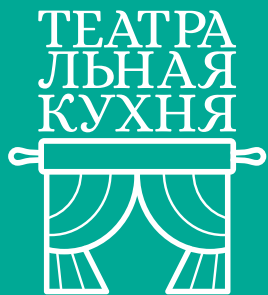
ГРАФИК РЕАЛИЗАЦИИ ВСЕРОССИЙСКОГО ОБРАЗОВАТЕЛЬНОГО ОНЛАЙН-КЛУБА ШКОЛЬНЫХ И САМОДЕЯТЕЛЬНЫХ ТЕАТРОВ «ТЕАТРАЛЬНАЯ КУХНЯ»